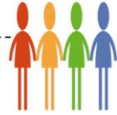
ข้าราชการส่วนท้องถิ่น